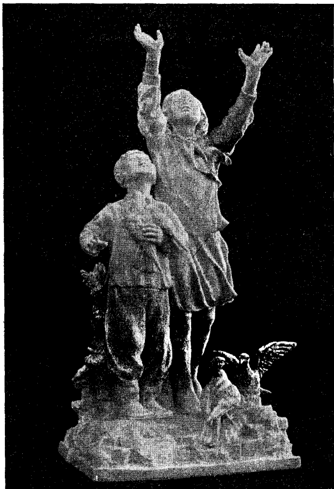
Рис. 5. Корейские дети с голубями (неполивной фарфор). Худ. Н. А. Малышева

Выставка показала, что в советском декоративно-прикладном искусстве нашли многостороннее отражение жизнь, мысли и чаяния советского народа, наиболее вол-