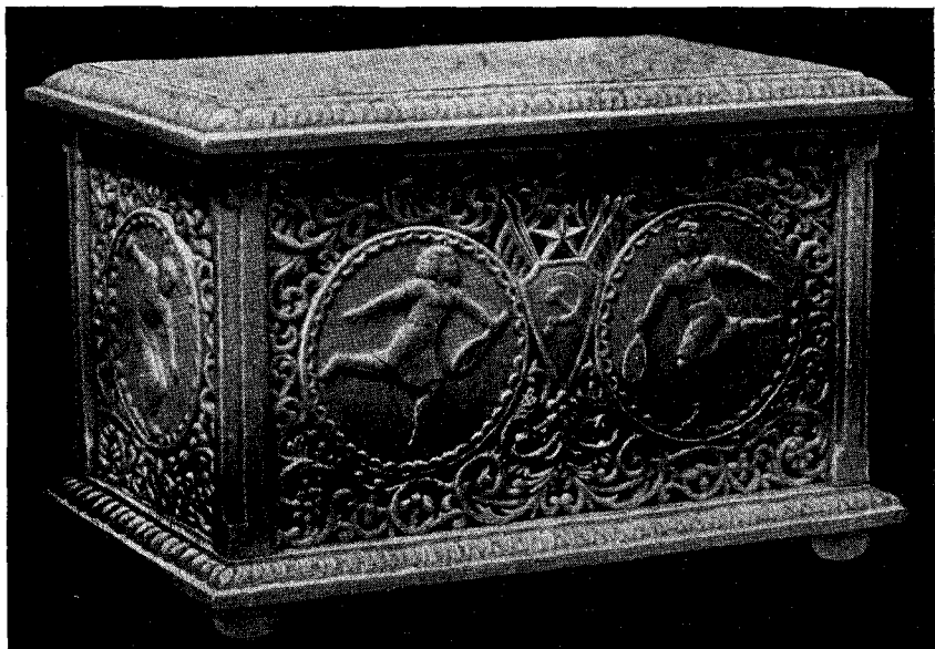
Рис. 2. Ларец «Спорт» (резьба по мамонтовой кости). Работа Д. Скубенко, 1948 г.

Новый материал для миниатюрной скульптуры очень удачно применен Ленинградским домом народного творчества: фигурки птиц и животных выполнены искусным резчиком П. Ф. Симанковым из оргстекла (т. е. пластмассы).