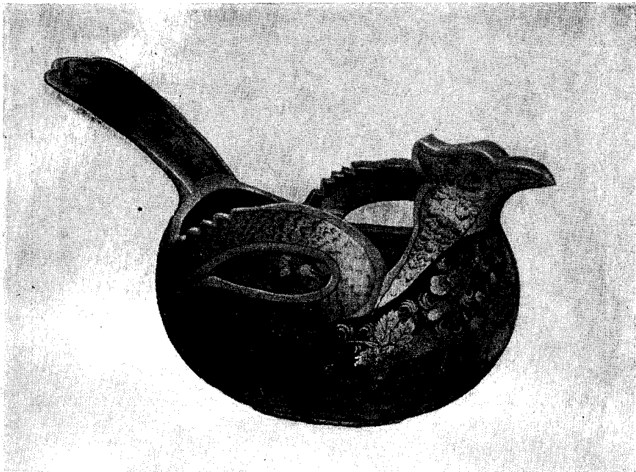
Рис. 1. Ковш «петух» (хохломяская роспись)

Видное место на выставке занимает художественная обработка кости и металла.