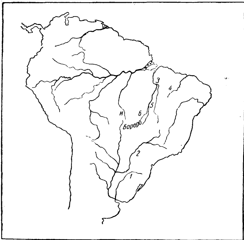
Племена группы же ; 1 — кайнганг штата Санта Катарина; 2 — кайнганг штата Сао Пауло; 3 — аинайе; 4 — рамкокамекра (канелья); 5 — перенте; 6 — шаванте Н. Ньямбикура

жалением автор признает полную неудачу своих попыток получить систему родства индейских наций Ю. Америки. Важность системы этих наций заключается в том, составляет ли она часть ганованской семьи». Для своей работы Моргану удалось получить лишь весьма неполные сведения о чибча Новой Гренады. С того времени о социальной структуре племен Южной Америки появилось немало сведений, но это были