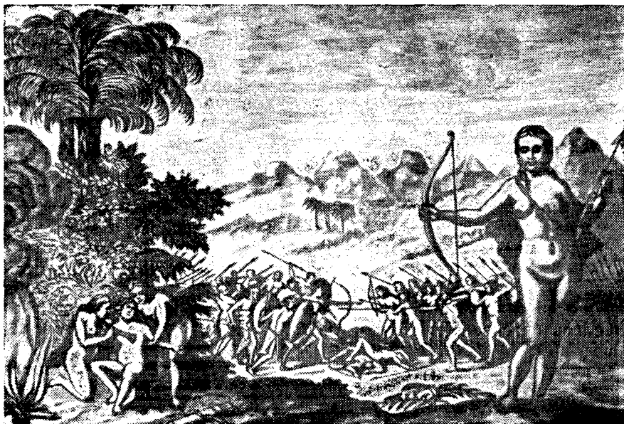
Рис. 1. Амазонки Мономотапа (Зап. Африка). Рисунок XVII в.

ми; родившихся мальчиков отсылают к отцам, а девочек воспитывают. Так же поступают женщины Эфиопии, которые тоже выжигают себе левую грудь, чтобы лучше стрелять из лука, которым они пользуются в войне и на охоте. Правительница этой страны не знает мужчин, за что эти женщины поклоняются ей, как богине. И Бермудес заключает свой рассказ указанием на различные чудеса и диковины этой страны 7 . Наконец, еще более поздний посетитель Абиссинии, испанский монах-доминиканец, Иоанн дос Сантос (ум. в 1622 г.), бывший здесь в 80-х гг. XVI в., рассказывает, что воинственные женщины царства Дамут в детстве прижигают себе правую грудь. Хотя они не замужем, но когда рожают детей, то только выкармливают, а затем отсылают к от-