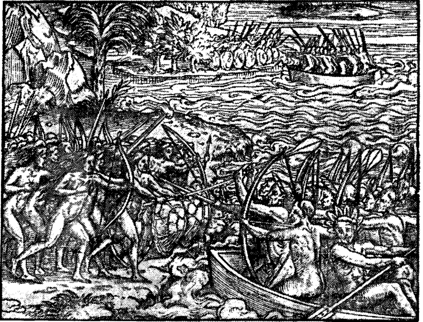
Рис. 2. Американские амазонки. Защита амазонками своих островов

рыбой, дичью, кореньями и плодами. Мальчиков убивают сейчас же по их появлении на свет или передают отцам, девочек оставляют у себя. Находясь обычно в войне с каким-либо народом, они весьма бесчеловечно обращаются с пленными, подвешивая их за ногу к ветке дерева, а затем убивают стрелами. Во время битвы эти амазонки испускают ужасные крики, чтобы устрасить врага». «Вопрос о происхождении амазонок Америки,— пишет далее Теве,— трудно решить. Одни полагают, что они распространились по всему миру после падения Трои, другие, что они из Греции переселились в Африку, а оттуда